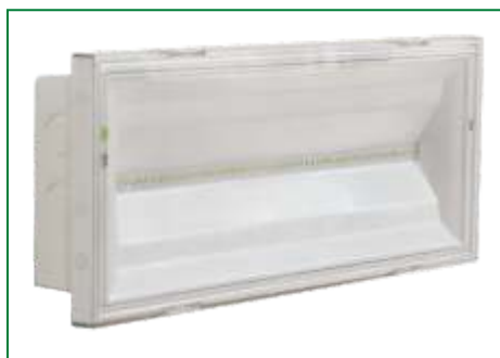
NexiTech LED so stropnou tabu kou